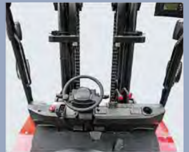
Der neu gestaltete Breitsichtmast bietet eine bessere Sicht nach vorne

Sie können die Tür auf jeder Seite öffnen, wodurch die Wartung des Motors, der Ölpumpe und der elektrischen Steuerung sehr bequem ist und eine gute Wasser- und Staubdichtigkeit gewährleistet ist