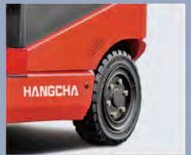
Vollreifen mit kleinen Abmessungen