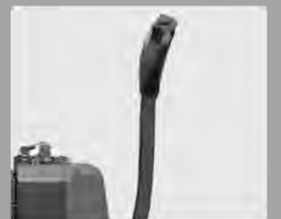
Einfache und schöne Pinne zur Verbesserung des Fahrkomforts