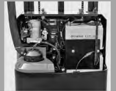
Die vollständig geöffnete Motorhaube ist leicht zu warten