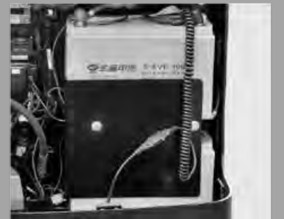
Eingebautes Ladegerät und wartungsfreier Gel-Akku, Sie müssen sich keine Sorgen machen