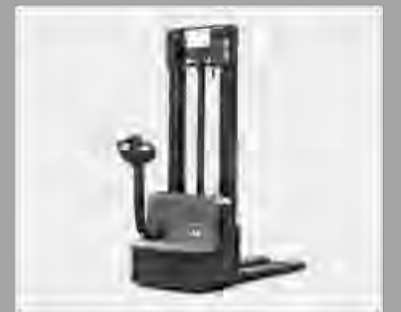
Optimierte Designstruktur für gute Sichtbarkeit und einfachen Zugang zur Palette