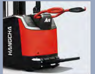
Die integrierte gestanzte Leitplanke bietet dem Bediener einen besseren Schutz