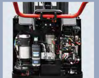
Die hintere Abdeckung kann vollständig geöffnet werden, und alle Komponenten und Teile sind auf einen Blick klar, was für die Wartung der gesamten Maschine sehr praktisch ist