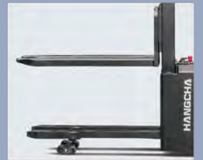
Der Palettenstapler mit anfänglichem Hub bietet eine höhere Effizienz