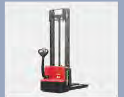
Optimierte Designstruktur für gute Sichtbarkeit und einfachen Zugang zur Palette