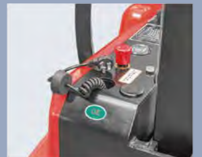
Eingebautes Ladegerät und wartungsfreier Gel-Akku sorgen für eine bequeme Nutzung