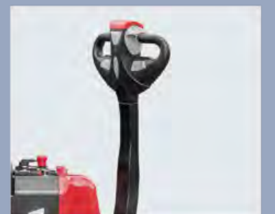
Einfache und schöne Pinne zur Verbesserung des Fahrkomforts