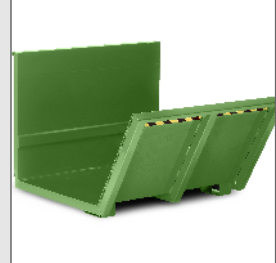
Langgutkipper Typ RLK