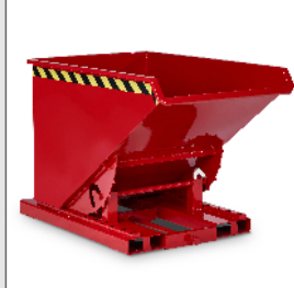
Automatikkipper TYP RMA