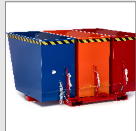
Muldenkipper Typ RUK Trio