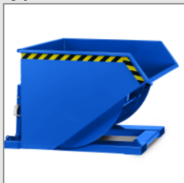
Schwerlastkipper Typ RTB