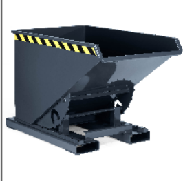
Abrollkipper Typ RAM