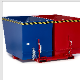
Muldenkipper Typ RUK Duo