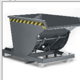
Selbstkipper Typ RSK