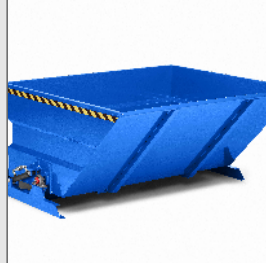
Großraumkipper Typ RGK