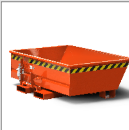
Minikipper Typ RMI