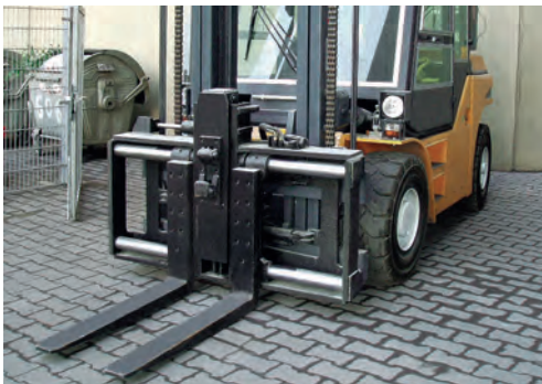
Zinkenverstellung mit integriertem Behälterentleerer

- Zinkenverstellung mit integriertem Behälterentleerer (S11 - ZVBEV) bitte anfragen.